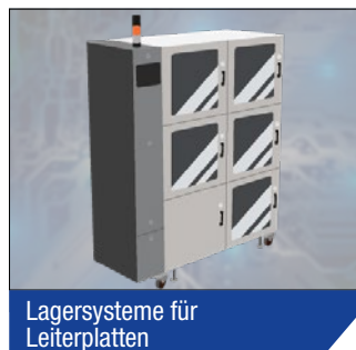
Lagersysteme für Leiterplatten