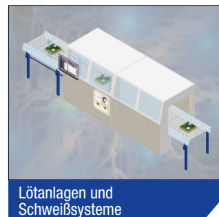
Lötanlagen und Schweißsysteme